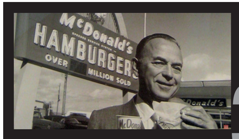
Die wahre Geschichte von McDonald's